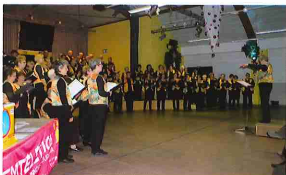
Concert de la chorale Crescendo

La municipalité et les associations Creuziéroises se sont une fois encore mobilisées pour la bonne cause en organisant un grand nombre d'actions sur la commune. Après un concert de la chorale Crescendo et la vente de gâteaux le vendredi soir, ce sont les associations sportives qui ont pris le relais le samedi : initiation au badminton, puis participation de 2 joueurs vedette de la JAV Clermont invités par le club de basket qui se sont prêtés gentiment à une démonstration de lancers francs suivis d'une séance de signature d'autographes. Une marche aux flambeaux et un repas dansant réunissant plus de 200 personnes ont clôturé ce weekend téléthon.