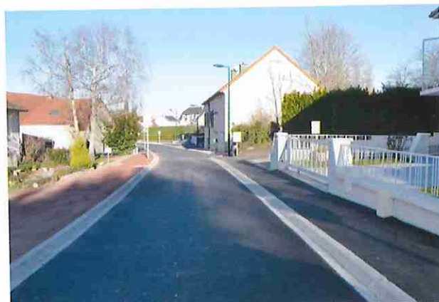
Travaux rue des Vergers