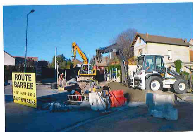
Début des travaux rue de Vichy