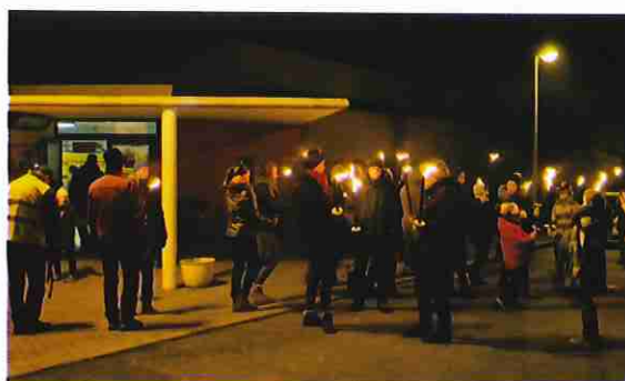
Retraite aux flambeaux

Encore BRAVO aux CREUZIEROIS au grand cœur.