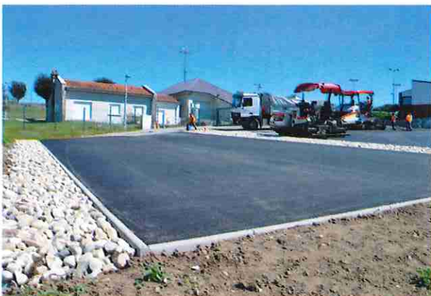
Aménagement du parking de la salle des fêtes