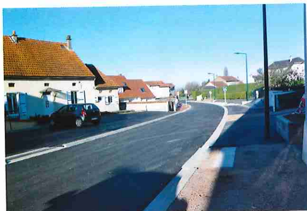
Travaux rue des Vergers