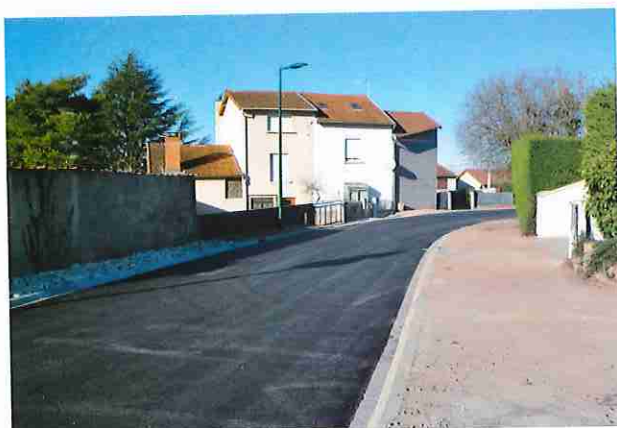
Travaux rue des Vergers