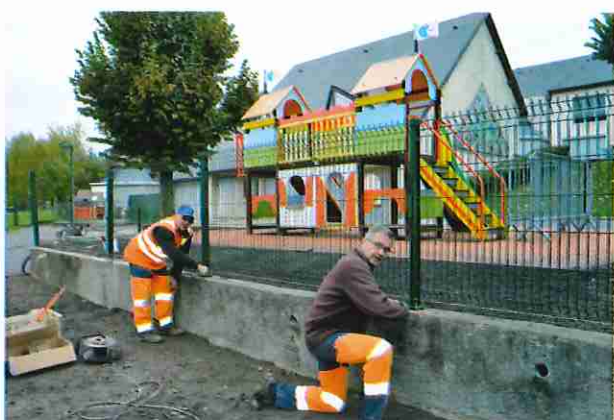
Pose d'une clôture à l'école maternelle