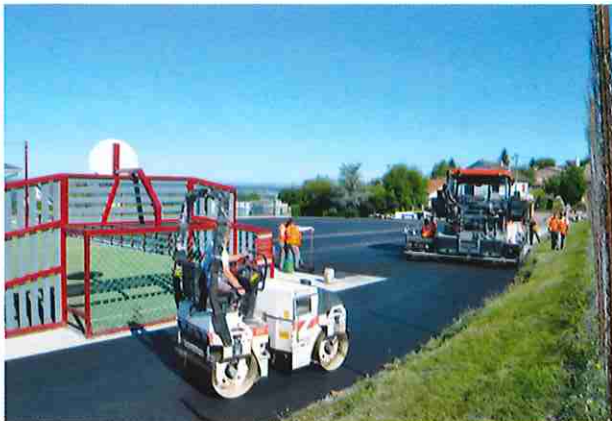
Aménagement du parking du stade