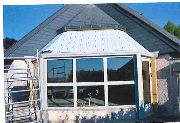
Changement des baies vitrées de l'école maternelle