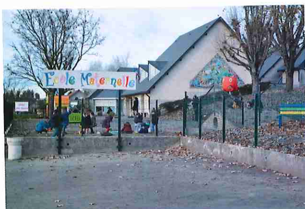
Relooking de la cour de l'école maternelle