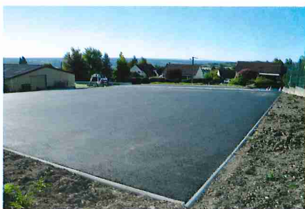
Aménagement du parking de la salle des fêtes