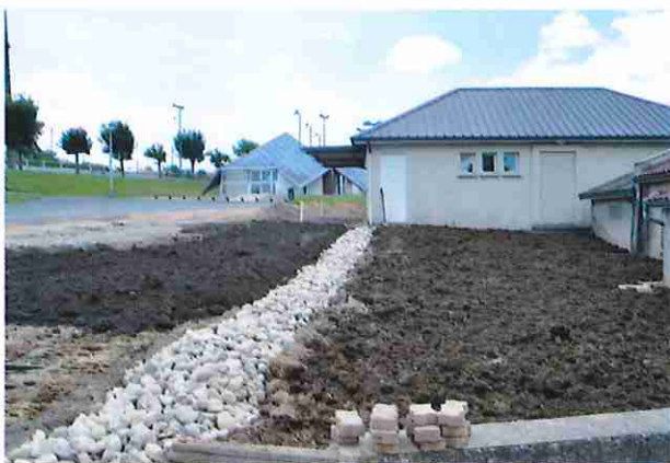
Aménagement des abords du local pétanque