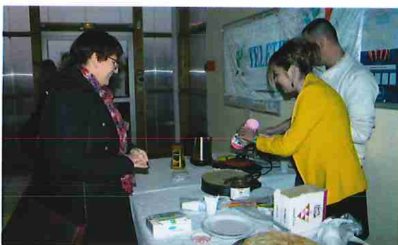
Vente de gâteaux

Cette édition 2016 du téléthon a rapporté quelques 5048 € sur notre commune.