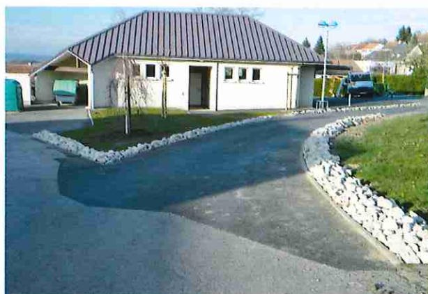
Aménagement des abords du local pétanque