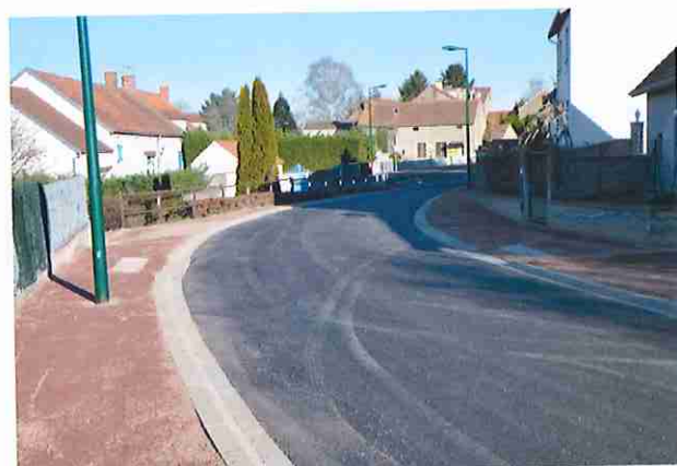
Travaux rue des Vergers