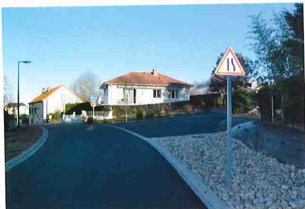
Travaux rue des Vergers