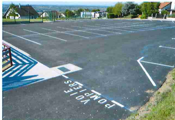
Aménagement du parking du stade