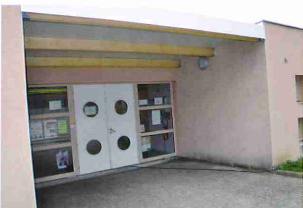
Pose d'un abri à la maison de l'enfance