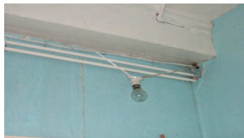
Eclairage insuffisant et dangereux