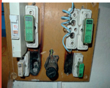
Branchements d'électricité vétustes

Les dispositifs de retenue des personnes, dans le logement et ses accès, tels que garde-corps des fenêtres, escaliers, loggias et balcons, sont dans un état conforme à leur usage.