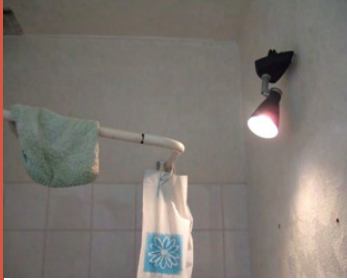
Branchement électrique dangereux