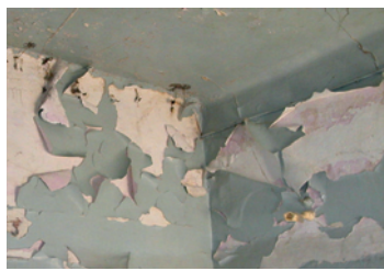
Peinture écaillée contenant du plomb

La lutte contre le saturnisme est de la compétence de l'ARS