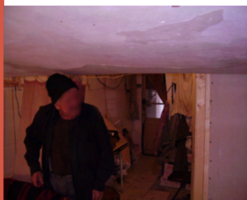
Hauteur sous plafond insuffisante

→ Un réseau électrique permettant le fonctionnement des appareils indispensables au quotidien.