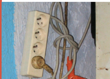
Installation électrique dangereuse

→ Un réseau électrique permettant le fonctionnement des appareils indispensables au quotidien.