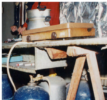
Coin cuisine de "fortune" hors norme et dangereux

Les caractéristiques de décence pour la cuisine