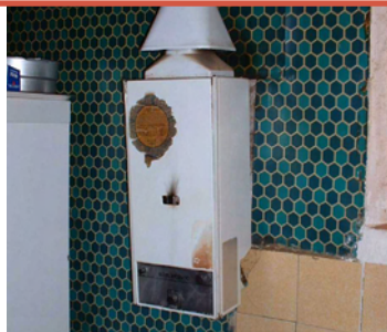
Absence de dispositif d'évacuation des gaz brûlés

Des installations d'évacuation des eaux ménagères et des eaux-vannes empêchant le refoulement des odeurs et des effluents et munies de siphon.