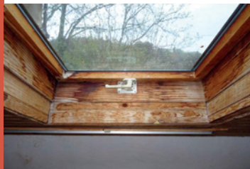
Absence de protection contre les infiltrations d'eau