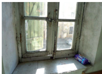
Menuiserie non étanche

La nature et l'état de conservation et d'entretien des matériaux de construction, des canalisations et des revêtements du logement ne présentent pas de risques manifestes pour la santé et la sécurité physique.