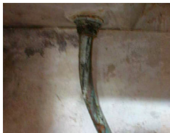
Absence de siphon

Une cuisine ou un coin cuisine permettant d'utiliser un appareil de cuisson et comprenant un évier alimenté en eau chaude et froide et raccordé à une installation d'évacuation des eaux usées. L'eau dans le logement doit être potable.